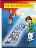
CHEMIN DE CROIX Avec Jésus changer le monde!