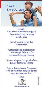
PRIÈRE À SAINT-JOSEPH

SUR LE SITE DE MONDAMI.CA, FORMAT PDF SEULEMENT