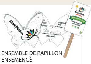
ENSEMBLE DE PAPILLON ENSEMENCÉ