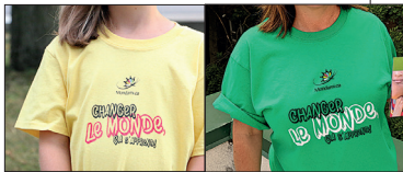
CHANDAIL ENFANT CHANDAIL ADULTE