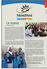
CAHIER MOND'AMI Également sur le site en format PDF

Commandez par téléphone, par courriel, par la poste ou par télécopieur Téléphone : 514 844-1929 Ligne sans frais : 1 866 844-1929 Télécopieur : 514 844-0382 Contact : Ginette Côté – coordonnatrice.opem@opmcanada.ca