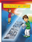
CHEMIN DE CROIX Avec Jésus, changer le monde!