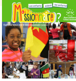
CARNET POUR LE MOIS MISSIONNAIRE