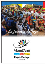
CAHIER MOND'AMI Également sur le site Web en format PDF