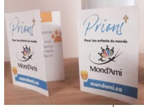
LIVRET DE PRIÈRES